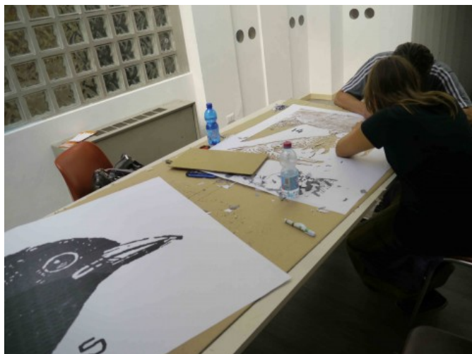
Lecco Street View, una fase del workshop di Lucamaleonte

Scritto da Francesco Sala | venerdì, 6 settembre 2013 · 1 commento