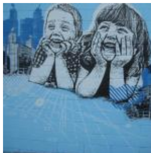
Sbocciano i muri di Lecco.