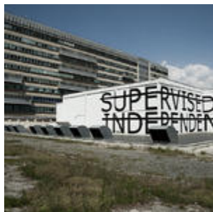
Street Art a Roma. Parte