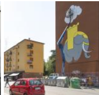
Bologna è street. Work in progress sui muri di ...