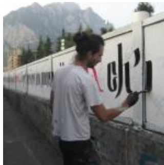
La Giornata del Contemporaneo? A Lecco dura qua ...