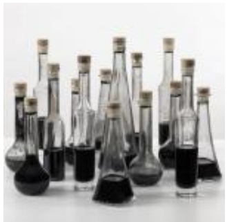
Gaspare: distruzione e rigenerazione