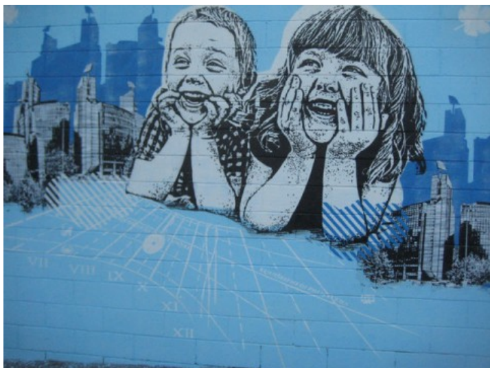
Lecco Street View 2011